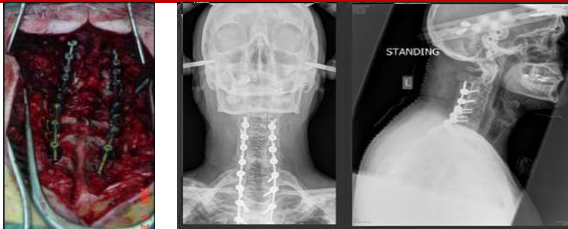
شکل ۳ - تصویرهای هنگام عمل و پس از عمل