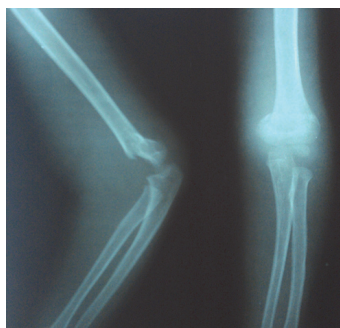
شکل ۱. پرتونگاری

ابتدا برای تمام بیماران، جاناندازی با روش بسته انجام شد. برای پین‌گذاری از سمت لترال، دو یا سه پین از اینفریور به سوپریور برای ایجاد پایداری در ستون سمت لترال و یک یا دو پین از سوپریور به اینفریور از سمت پروگزیمال به شکستگی برای ایجاد پایداری در ستون مدیال استفاده شد (شکل ۱ و ۲).