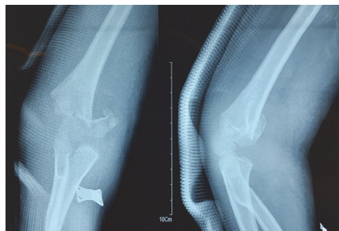
شکل ۳. شکستگی تیپ ۴ سوپراکونندیل همروس پسر ۴ ساله

داده‌های کیفی به صورت جداول فراوانی و درصد استخراج و داده‌های کمی به صورت میانگین و انحراف معیار محاسبه شدند. جهت مقایسه داده‌های کمی از آزمون پارامتری t برای گروه‌های مستقل ۱ ، و برای داده‌های کیفی از آزمون غیرپارامتری مجذور کای ۲ ( \chi^2 ) و آزمون دقیق فیشر ۳ استفاده شد. داده‌ها با نرم افزار آماری SPSS تحلیل، و سطح معنی داری p < 0.05 در نظر گرفته شد.