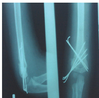
شکل ۲. روش پین‌گذاری