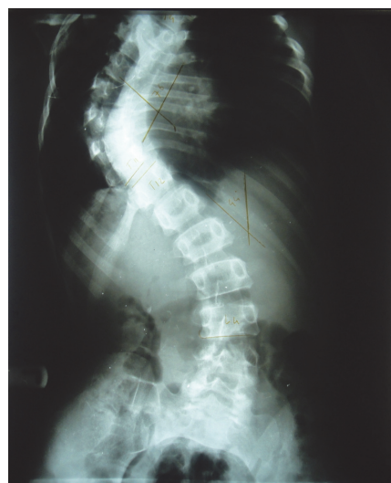
شکل ۱. اسکولپوز توراسیک و لومبار قبل از جراحی

دو هفته بعد از افیوژن پوستریور، میزان افیوژن به کمتر از ۱۰۰ سی سی مایع ترانسودای شفاف رسیده؛ بنابراین TPN متوقف و رژیم کم چربی شروع شد. سه هفته بعد از افیوژن، درن قفسه سینه خارج شد در حالی که مقدار افیوژن کمتر از ۳۰ سی سی بود. بیمار با حال عمومی خوب و در حالی که کدورت ریه برطرف شده بود، صداهای ریوی نیز طبیعی شد و با O 2 Sat: ۹۶٪ و RR: ۱۲ ترخیص گردید. در طی بستری، بیمار با عوارض غیرشایع کایلوتوراکس شامل اختلالات متابولیک و ایمنولوژیک مواجه نشد.