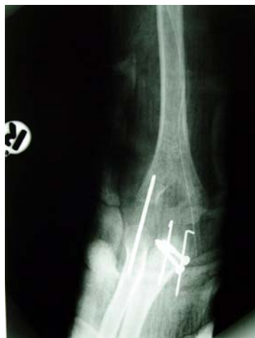
شکل ۴. پرتونگاری‌های پس از عمل