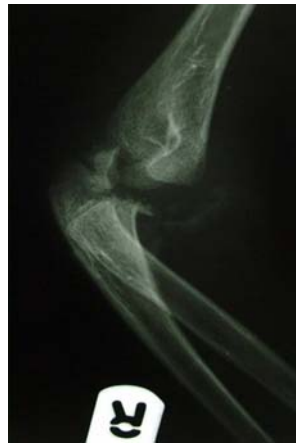
شکل ۲. پرتونگاری طرفی آرنج