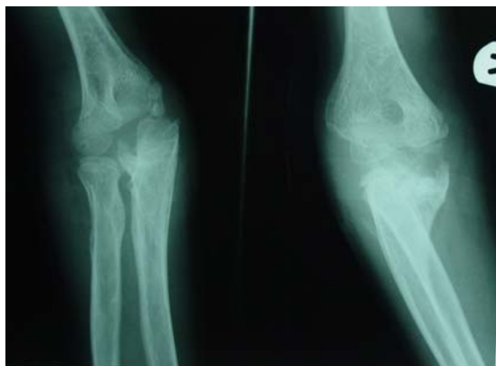
شکل ۵. شش ماه پس از عمل

دو هفته بعد پین ضخیم از آرنج خارج و آتل برداشته شد و حرکت فعال آرنج شروع گردید. بیمار از روز بعد از عمل به مدت ۶ هفته، ایندومتاسین (۵۰ میلی‌گرم روزانه) دریافت نمود. پین‌های اوله کرانون دو ماه بعد و پیچ‌ها، شش ماه پس از عمل خارج شدند و در این مدت به طور مرتب پرتونگاری کنترل از بیمار به عمل آمد (شکل ۵).