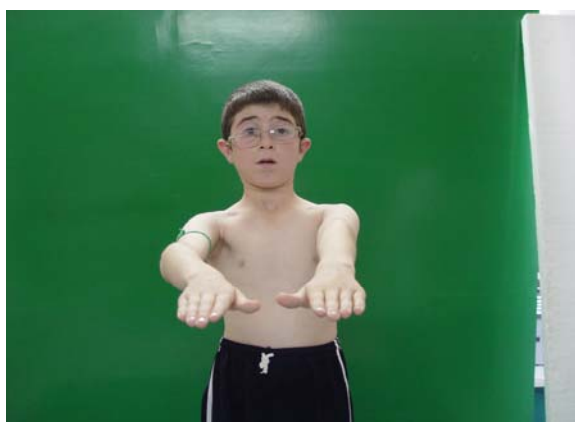
شکل ۶. حرکات خم و راست شدن و چرخشی بیمار شش ماه بعد از عمل جراحی

افزایش دهد، اما در برخی مطالعات تأثیر عامل زمان خیلی مهم قلمداد نشده است (۱۲) .