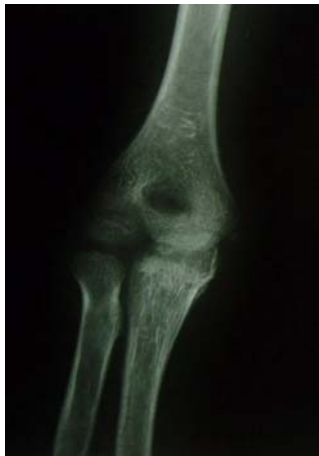
شکل ۱. پرتونگاری جلویی - پشتی آرنج