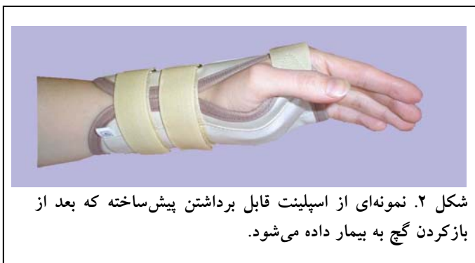
شکل ۲. نمونه‌ای از اسپلینت قابل برداشتن پیش‌ساخته که بعد از بازکردن گچ به بیمار داده می‌شود.

در بیماران گروه اول، در صورت عدم جابه‌جایی در پرتونگاری، کنترل سه هفته بعد از عمل از طریق حفظ پین‌ها در جای خود انجام و گچ بیمار به طور کامل باز شده و یک بریس قابل برداشت به بیمار داده شد. از همین زمان به بیماران آموزش داده شد که علاوه بر انجام حرکات «شش‌تایی»، حرکات مچ را هم شروع کنند. بیماران مچ‌بند را هر روز پنج بار به مدت پنج دقیقه باز کرده، مچ را با احتیاط در جهات مختلف حرکت دادند. در پایان هفته ششم، پرتونگاری کنترل انجام شد. در صورت جوش خوردگی مناسب از نظر رادیولوژیک و بالینی، پین‌ها خارج شدند و مچ‌بند به مدت دو هفته دیگر ادامه یافت. در مورد بیماران گروه دوم کلیه اقدامات تا پایان هفته سوم مشابه گروه اول بود. در این گروه گچ تا پایان هفته ششم ادامه یافت، اما در هفته چهارم گچ از ناحیه آرنج کوتاه و حرکات آرنج شروع شد. پس از تهیه پرتونگاری کنترل در پایان هفته ششم، گچ به طور کامل باز شده، پین‌ها خارج شدند و مانند گروه اول یک اسپلینت قابل برداشت تا پایان هفته هشتم داده شد (شکل ۲).