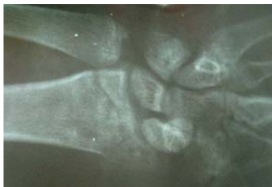
شکل ۳. پرتونگاری پس از خروج ثابت کننده خارجی