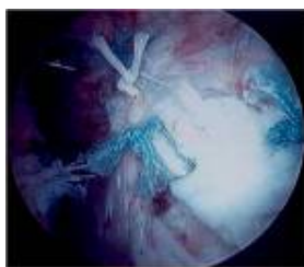
شکل ۴. ترمیم پارگی روتاتورکاف