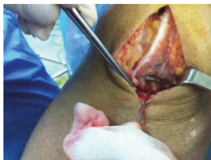
شکل ۳. بلوک استخوانی تیبیا توسط منگنه به تونل ثابت شد.