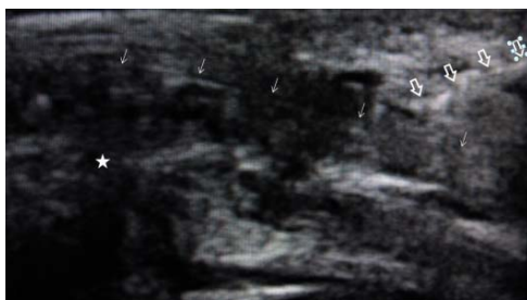
شکل ۲. نمای طولی ورود سوزن در سونوگرافی. (پیکان‌های توخالی: سوزن، پیکان‌های توپر: تاندون، ستاره: مفصل متاکارپوفالانژیال اول)