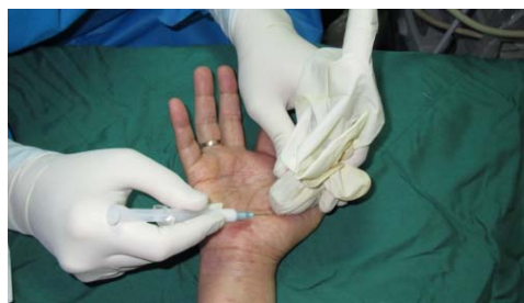
شکل ۱. وارد کردن سوزن با زاویه ۳۰-۴۵ درجه