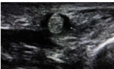
شکل ۴. نمای عرضی از تاندون در سونوگرافی در پی تزریق کورتیکواستروئید (پیکان‌ها: تجمع مایع درون غلاف در اطراف تاندون)