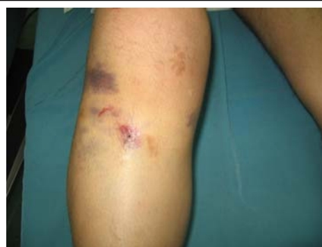
شکل ۱. اکیموز در سمت مدیال و لترال زانو