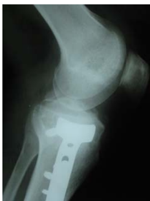
شکل ۵. جوش نخوردگی اوالسیون رباط متقاطع پشتی یک‌سال بعد از عمل