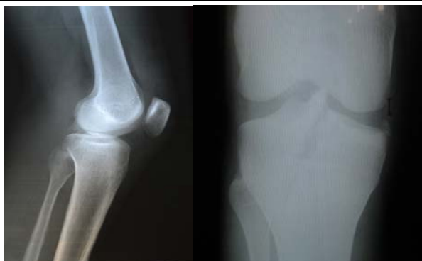
شکل ۲. پرتونگاری قبل از عمل نمایانگر اوالسیون موجود در پلاتو مدیال تی‌بیا