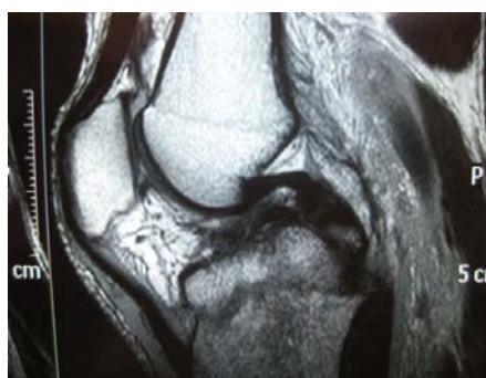
شکل ۴. ام‌آر‌آی قبل از عمل