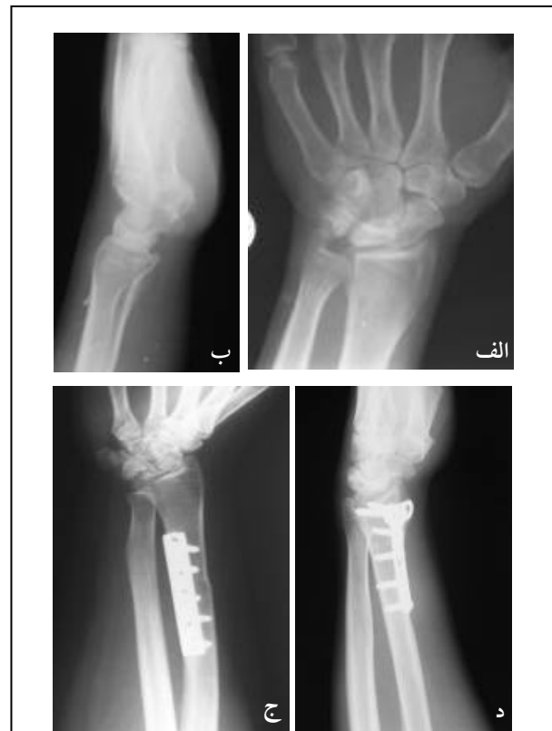
شکل ۵. پرتونگاری قبل از عمل دو بیمار دچار مرحله IIIa بیماری کین‌باخ. الف) نمای رخ و نیم‌رخ، ب) نمای جانبی. ج و د) پرتونگاری‌های ۴ سال پس از عمل که بیماری در همان مرحله IIIa باقی مانده است.

میانگین مدت زمان پیگیری بیماران 5 \pm 2/44 سال بود. در مراجعه نهایی، معیارهای پرتونگاری در عکس‌های جدید اندازه‌گیری شدند (شکل ۵). بیماران از نظر درد، دامنه حرکتی و قدرت مشت کردن مورد بررسی قرار گرفتند. همچنین برای هر بیمار معیار Quick DASH تکمیل گردید. این معیار شامل ۱۱ سؤال است و تأثیر مشکل پیش آمده در انجام فوقانی بر عملکرد بیمار را در یک هفته اخیر بررسی می‌کند. نمره آن بین صفر (بهترین حالت) تا ۱۰۰ (بدترین حالت) متغیر می‌باشد (۱۸) .